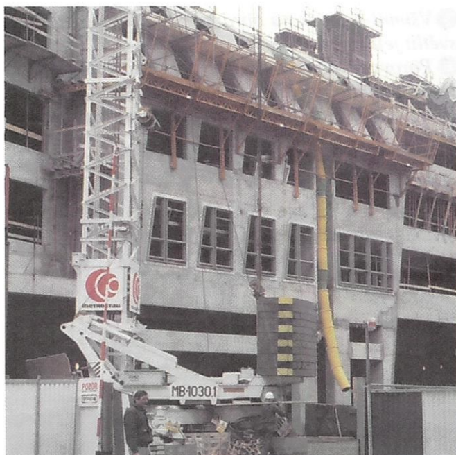
Různá pracovní prostředí