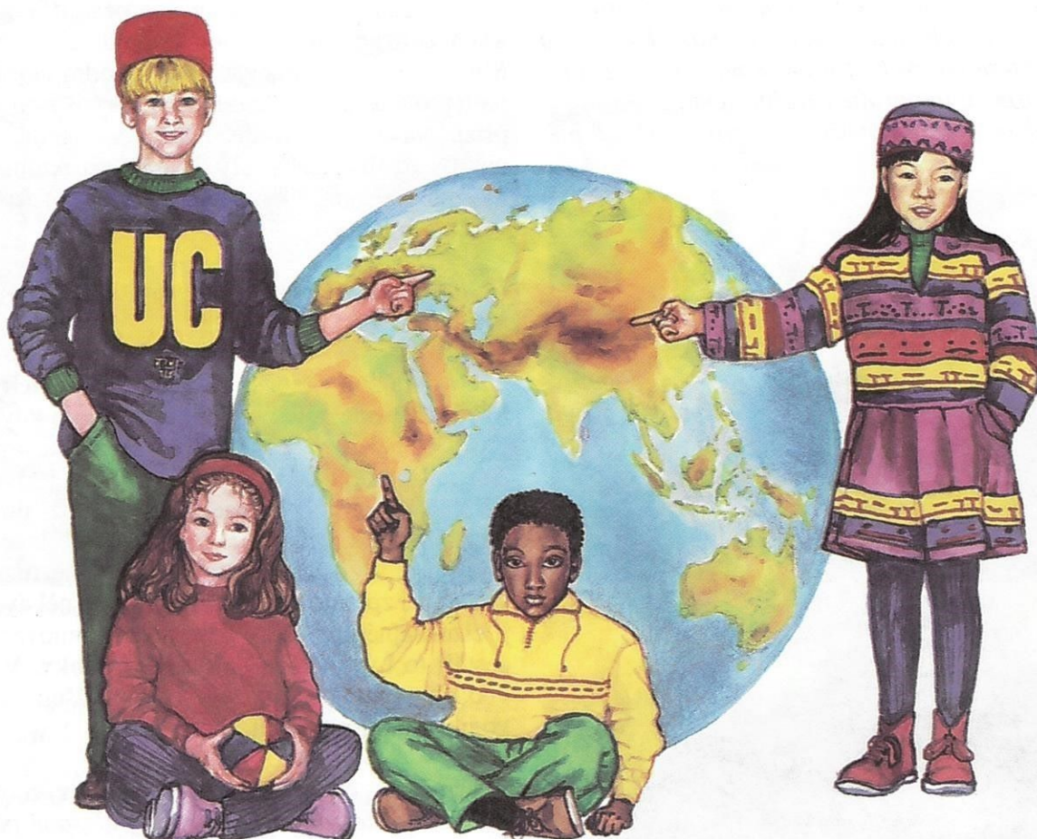
Všude žijí lidé